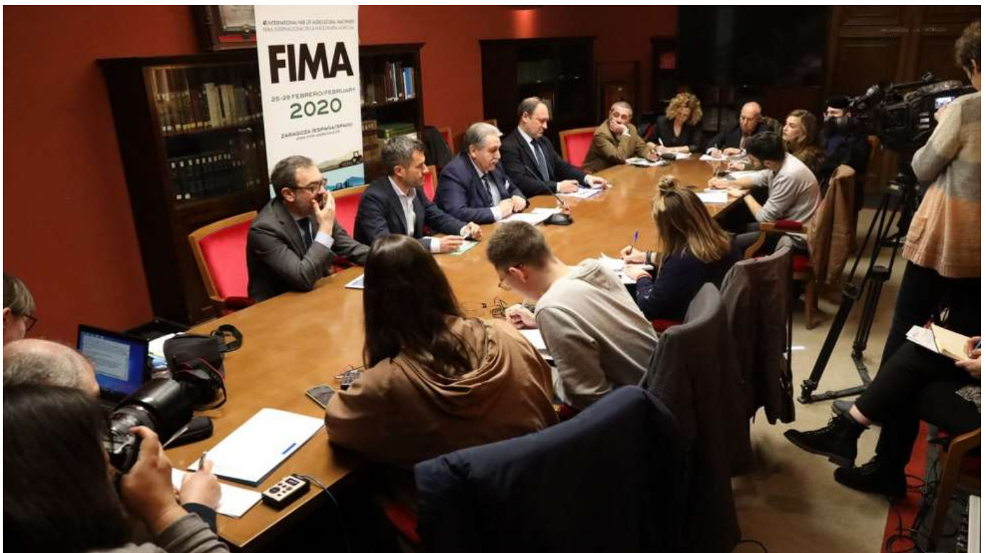
Conferencia de prensa celebrada el martes 18 de febrero en la Cámara de Comercio de Zaragoza.

Teruel puso de manifiesto el volumen de empresas extranjeras (937), que supone un 57% del total de las empresas expositoras. En este sentido, afirmó que el incremento del número de empresas es del 5% con la presencia de 264 marcas que participan por primera vez en este certamen, lo que indica "el elevado interés que despierta FIMA en el sector". El impacto económico previsto en Zaragoza y zonas aledañas es de 350 millones de euros.